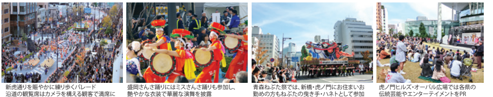
新虎通りを賑やかに練り歩くパレード沿道の観覧席はカメラを構える観客で満席に 盛岡さんさ踊りにはミスさんさ踊りも参加し、艶やかな衣装で華麗な演舞を披露 青森ねぶた祭では、新橋・虎ノ門にお住まいお勤めの方もねぶたの曳き手・ハネトとして参加 虎ノ門ヒルズ・オーバル広場では各県の伝統芸能やエンターテインメントをPR

11月19-20日(土・日)の2日間に渡り、新虎通り初の大規模イベント「TOKYO SHINTORA MATSURI」が開催されました。メインイベントの「東北六魂祭パレード」では、東日本大震災からの復興を願い、青森ねぶた祭や秋田竿燈まつりなど、東北6県の祭りが一堂に会しました。東日本大震災が発生した2011年から毎年、東北の各県を順番に巡っていますが、今年6月に開催した青森県で東北6県を一巡したことを記念し、今回初めて、東京でも開催されました。パレードではおよそ370人の参加者が新虎通りを練り歩き、小池百合子都知事も視察に訪れ、東北の復興を呼びかけました。