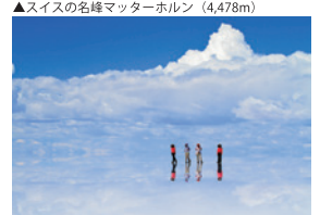
▲「天空の鏡」ウユニ塩湖（ボリビア）

アルパインツアーの山旅は、頂を目指す登山だけに留まりません。世界遺産への訪問、脈々と歴史が受け継がれる古都の散策など、価値ある文化や伝統に触れ、郷土料理を堪能するのをもた旅の醍醐味です。季節折々の山や自然・絶景・文化・歴史・世界遺産・音楽・料理など…、何ものにも代えがたい感動の旅をお手伝いします。また、花や鳥などの自然観察を目的とした企画も手掛けています。