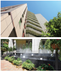
◀カスケードのミストが外構を潤します。

2016年には公益財団法人東京都公園協会が作成・発行する「まちなみつくろ緑マップ」において、「まちの緑好きが選ぶ東京の緑100選」に選出されたほど緑が豊富なモメント汐留。水と緑のカスケード、外構部を彩るハンギングバスケットなどの植栽のほか、プラタナスの木陰にはベンチをしつらえ、潤いの公共空間を創出しています。