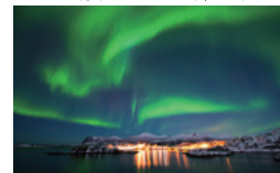
▲極北の夜空に舞うオーロラ（ノルウェー）