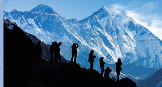
▲世界最高峰エベレスト（8,848m）の朝焼けを望む（ネパール）