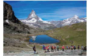
▲スイスの名峰マッターホルン（4,478m）

“トレッキング”を日本に浸透させた立役者、アルパインツアーサービスは世界の山旅のパイオニアとして日本の山岳旅行業界をリードしてきました。山や大自然を舞台に企画されるツアーは全てのコースがオリジナルティ溢れるもので、ゆったりとホテルに連泊しながらの日帰りハイキングから、標高5,000mの超高所や20日間にもわたるトレッキングまで、年間500本の海外と700本を超える国内の山旅を企画、実施。その他、様々な登山の楽しみ方をご案内する机上講座や説明会も開催しています。