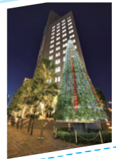
◀モメントの木 (写真手前) は約18mにもなるグリーンモニュメント。夜はイルミネーションが灯り、撮影スポットとしても人気。ヒートアイランド現象緩和効果に貢献。